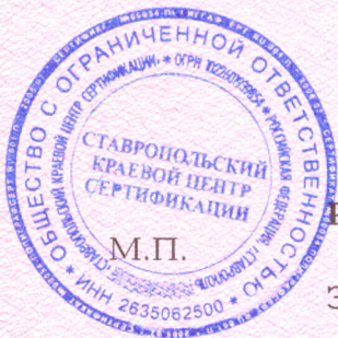
Схема сертификации 4

акта оценки оказания услуг от 22.05.2017г. №476